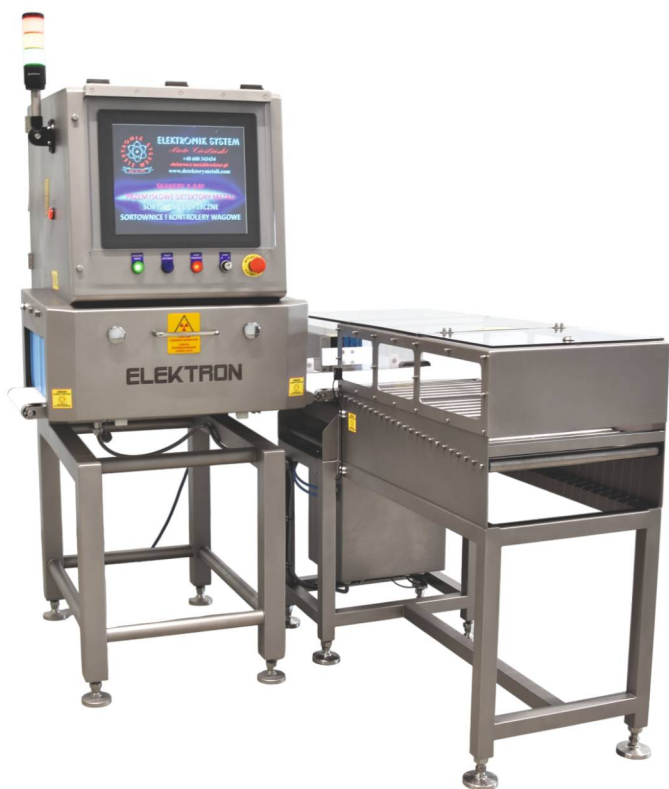
Spychacz z paletą rolkową