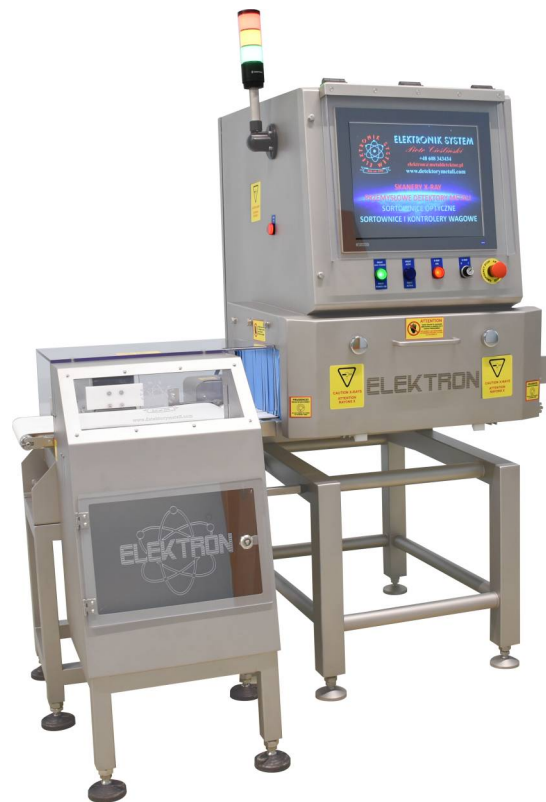
Spychacz z pojemnikiem zamykanym na klucz